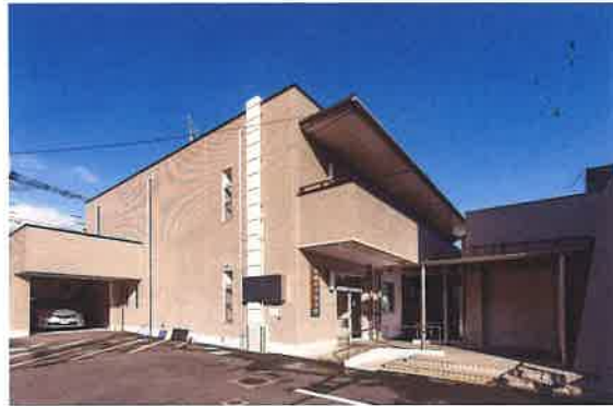
高鍋町役場敷地内にある高鍋町舎別館 1階にあります