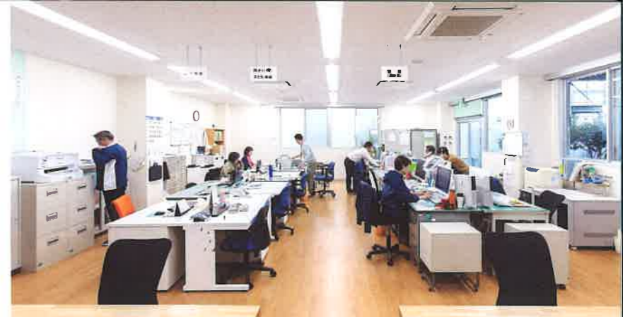
電話相談からセンター内での面談・ご相談まで、どなたでもご利用できます。